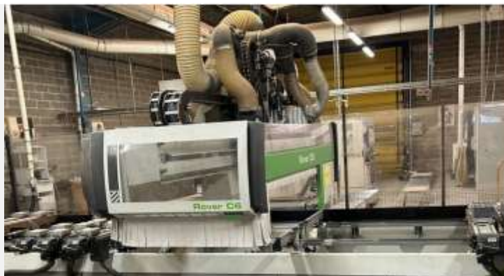
Biesse Rover yläjyrsinkone

Mekin olemme toteuttaneet joitakin postproessorien räätälöintejä , käyttäen CAM toimittajan kirjastopostproessoria lähtökohtana.