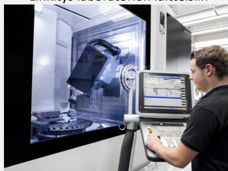
Monipuolista osaamista tukemassa