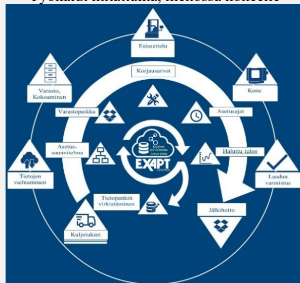
TLM = Työkalujen elinkaaren hallinta